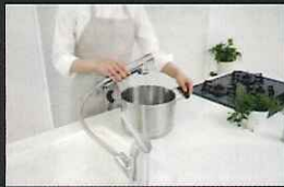
浄水器ごとホースが引き出せる