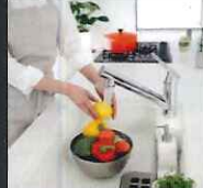
浄水でシャワーが使える