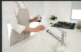
カートリッジ交換も簡単